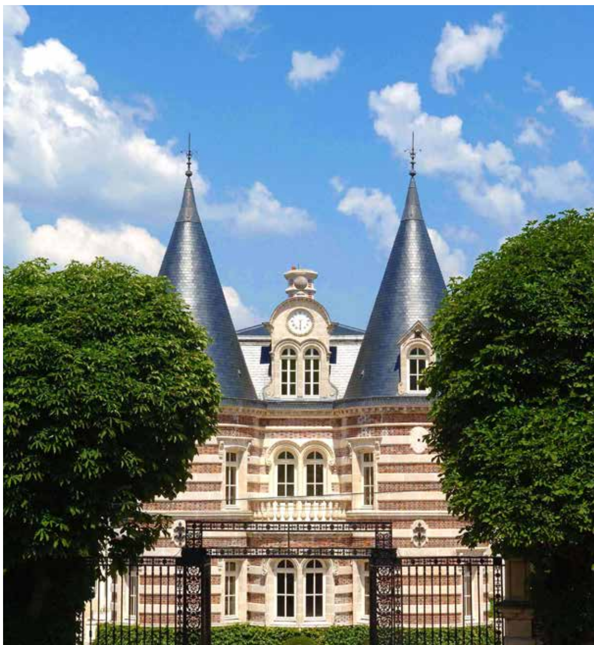
Pékin Castel, Avenue de Champagne, Epernay

“香槟葡萄园、酒庄和酒窖”的突出价值较这些景观大不相同。动荡的历史和地理位置形成了香槟地形，而这片土地上的人们深知如何在白垩岩中塑造出独特的遗产（农村、城市和地下）并在贫瘠的土地上产出享誉全球的香醇美酒。此次“香槟葡萄园、酒庄和酒窖”申遗成功是对这个独特遗产以及使香槟酿造法成为典范的能工巧匠的认可，同时鼓励人们继续努力维护并促进葡萄园景观发展。