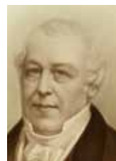
Portrait of Jean-Rémy Moët (1758-1840)

在十八和十九世纪，香槟贸易吸引并激起了我们的邻国德国的兴趣。香槟大酒店往往是法德友谊的结晶，如凯歌酒庄、库格酒庄或柏林格酒庄。这些大多是充满动力和创意的年轻德国人，他们来到香槟地区自我塑造、逐渐融合并最终加入或创建了自己的酒庄。