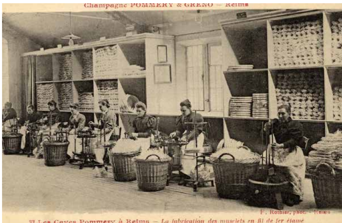
Making of wire-caps, Pommery estate