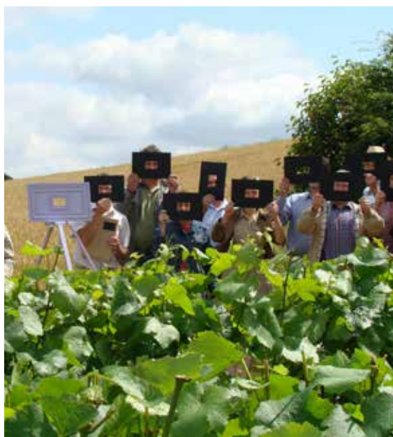
Pedagogical workshops in the vineyard