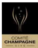
Logo of the Comité Champagne

我们通常谈论男性，但女性在香槟行业的历史和发展中占据了主导地位。首先值得一提的便是寡妇克利科-彭萨丁（1777年-1866年）和波默里（1819-1890），这两位标志性女性人物极大地促进了酒窖发展和香槟的国际声誉。作为特立独行的女性企业家，她们完全知道如何成为众人的焦点。但是所有其他女性也不应忽略，酿酒师的女儿、妻子或母亲，甚至是酒窖女工，无数个默默无闻的女性在葡萄园付出汗水。二十世纪下半叶，随着合作社的发展，酿酒商开始生产并出售自己的香槟，而他们的妻子在一旁无私地提供帮助。1980年，通过建立香槟葡萄种植总工会妇女委员会，女性终于得到了社会和专业人士认可。