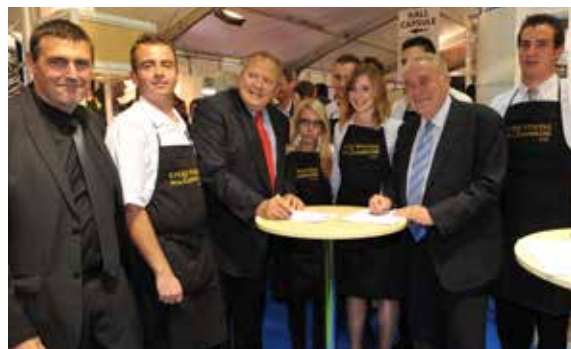
Signing of the Commitment charter, 2011

这是一个与每一个人息息相关的共同命运计划。该管理计划确定了这片土地上所有参与者的慎重承诺——无论来自行政单位、私营部门还是公民社会——都需一致决定确保遗产财富的永续价值。在人们满腔热忱行动的支持下，该计划已促进公共和私营部门对遗产财富进行重要保护和修复。评估和监测程序的建立将对遗产管理体系效果进行评估，并能迅速鼓励参与者通力协作。而列入世界遗产名录的遗产需每6年重新审查一次，这就显得更加必要！