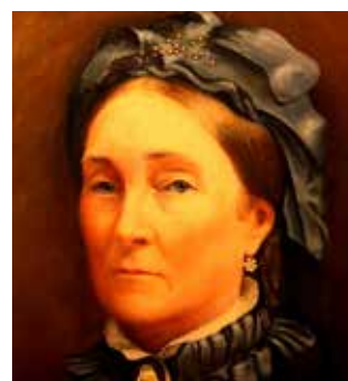
Portraits of Madame Pommery and Madame Clicquot- Ponsardin

在十九世纪的法国工业景观中，为了应对快速发展的生产，妇女作为工作人手的一大主力军，她们也在无意中引领着香槟酒庄：在此我们仅列举芭布·妮可·凯哥-彭萨丁、路易丝·波默里、玛蒂尔德·佩里耶或伊丽莎白·布林。人们把凿孔桌转瓶技术、玫瑰香槟的创作以及品牌通过大胆国际贸易获得成功等归功于凯歌夫人。渴望征服英国和北欧市场的路易丝·波默里在1870年推出了干型、极干型和天然型香槟。她不仅是一位女商人，更是一位爱心满满的女性，她为员工建立了第一个养老基金和社会保障，并为兰斯市建立了一所孤儿院和幼儿园。