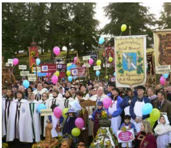
Saint-Vincent Celebrations 2014 displaying the colors of the candidacy

孩子们的活动总是颇值得赞赏。他们每年通过创意竞赛、趣味出版媒介或释放气球等方式多次参与到这个项目中来。