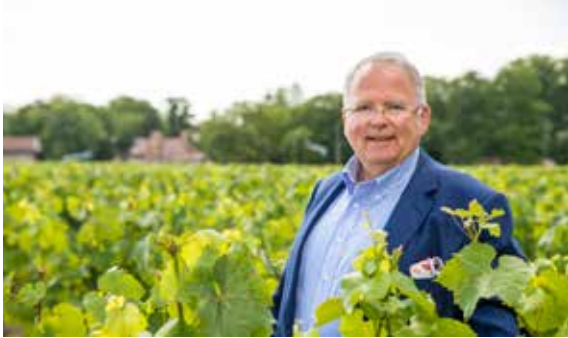
Old Piper Cellar, Avenue de Champagne, Epernay