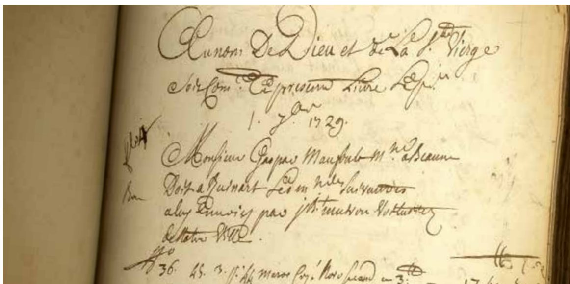
First book of accounts dedicated to Champagne wine of Nicolas Ruinart, 1729