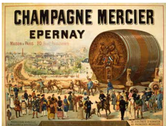
Mercier Advertisement poster, the cask at the universal exhibit, 1889