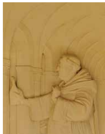
Bas-relief de dom Pierre Pérignon