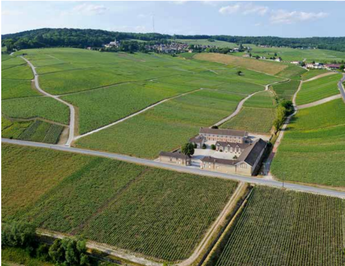
Sainte-Hélène, wine-making facility, Hautvillers

任何世界遗产候选项目都需要对申报的遗产财富进行定义和划界。这需要根据严苛的标准进行多种选择，以确保香槟葡萄园、酒庄和酒窖“突出的普遍价值”。因此，位于马恩省、奥布省、埃纳省、上马恩省和塞纳 - 马恩省的香槟AOC生产区腹地，选定的遗产财富综合体现为葡萄生长和成熟的供给地、装配和醇化的酿造地以及香槟陈列并销往世界各地的销售点地。申遗财富由14个项目组成，分为三个代表性大类——历史悠久的葡萄园山坡、圣-尼凯斯山丘和香槟大道——位于香槟 - 阿登大区马恩省，占地1100公顷。每片遗址周围均划定一块需要警惕的“缓冲”地区，以促进对遗址的保护。遗产财富周围还划有一块接合区，以保护香槟的景观和遗产。该区域包含320个香槟AOC产区市镇。