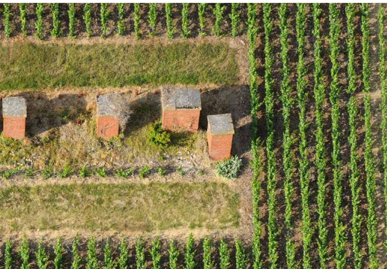
Vent stacks marking the presence of cellars, Aÿ

这一无与伦比的地下景观是全球葡萄酒行业遗产最具代表性的典范之一，如今仍然方兴未艾。