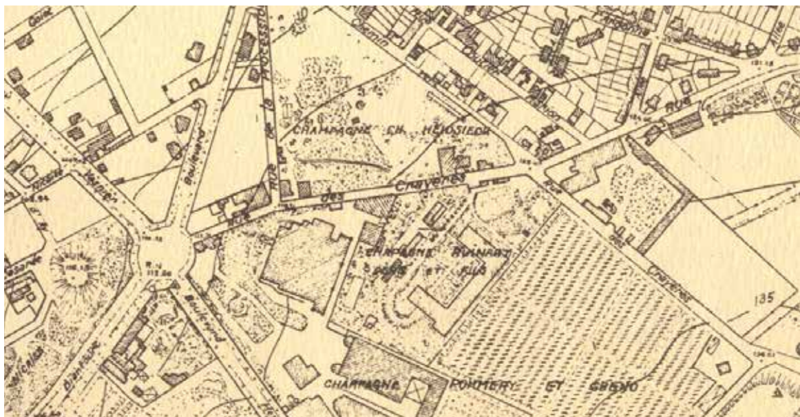
Map of the Saint-Nicaise Hill 1948